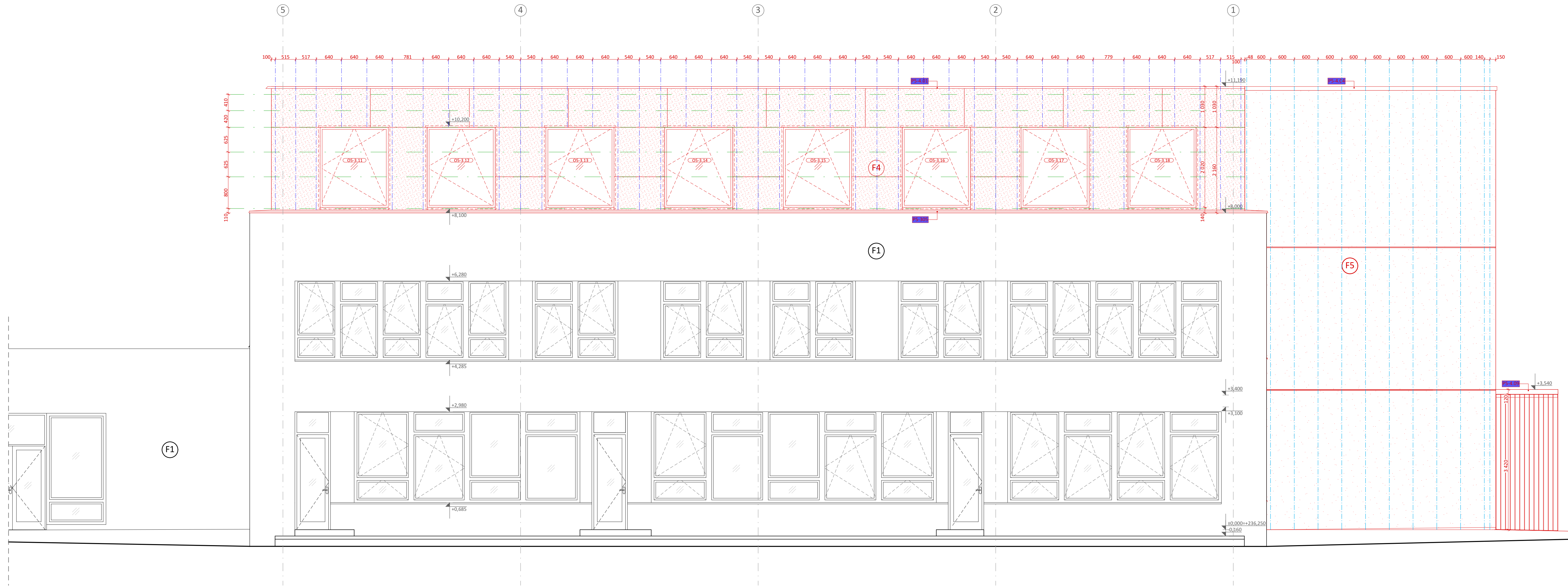
POHLED JIHOVÝCHODNÍ - navrhovaný stav